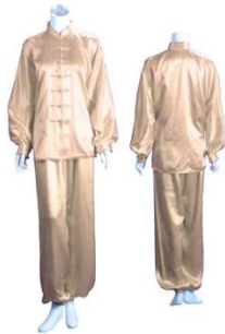
Ejemplo de uniforme válido para taijiquan